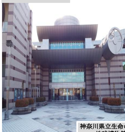
神奈川県立生命の星 地球博物館