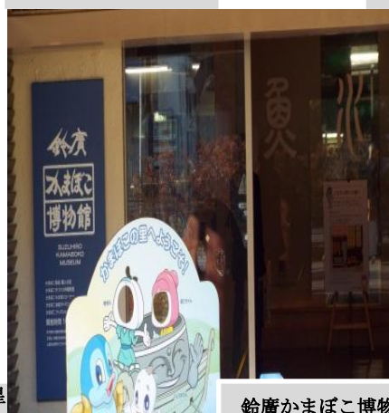
鈴廣かまぼこ博物館