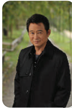
俳優・かながわ観光親善大使 船越 英一郎さん